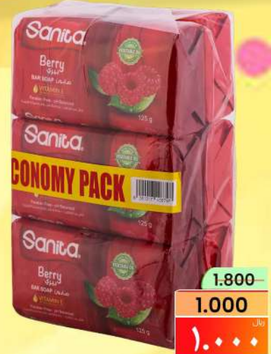
صابون سانيتا SANITA SOAP ASSTD 6X125GM