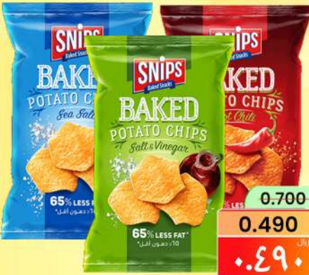
سنيبس رقائق البطاطس SNIPS POTATO CHIPS ASSTD 150GM/PCS