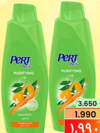
شامبو برت PERT SHAMPOO ASSTD 2X600ML