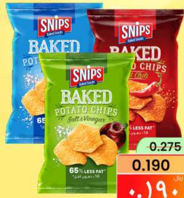
سنيبس رقائق البطاطس SNIPS POTATO CHIPS ASSTD 42GM/PCS