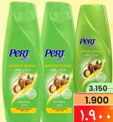
شامبو برت PERT SHAMPOO 2X400ML+CONDITIONER