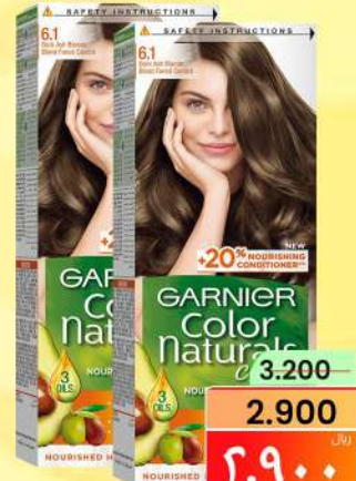
صبغة شعر غارنييه نات GARNIER NAT HAIR COLOR TWIN PACK