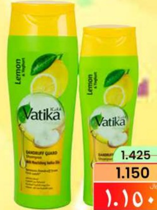
شامبو فاتيك VATIKA SHAMPOO 400M+200ML