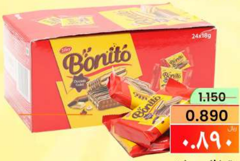
تيفاني بونيتو TIFFANY BONITO 24X18GM