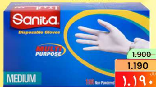
سانيتا - قفازات للاستعمال SANITA DISPOSABLE GLOVES 100S