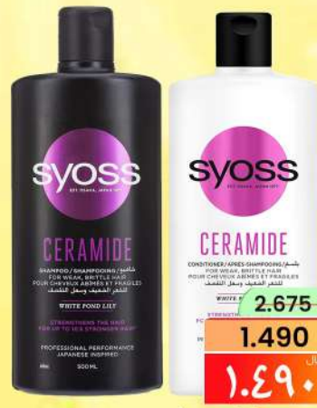
سيوس شامبو +بلسم SYOSS SHAMPOO 500ML+CONDITIONER 500ML