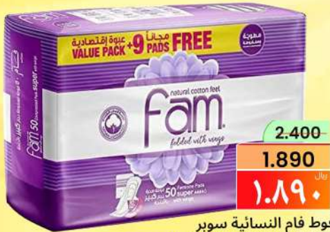
فوط فام النسائية سوپر FAM FEMININE PADS SUPER 41+95