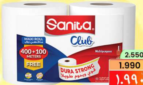
سانيتا ماكسي رول كلوب SANITA MAXI ROLL CLUB 400+100MTR