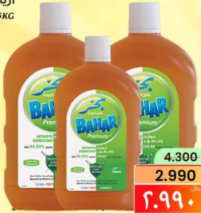
سائل مطهر ممتاز BAHAR PRM ANTISEPTIC 2X750+500ML