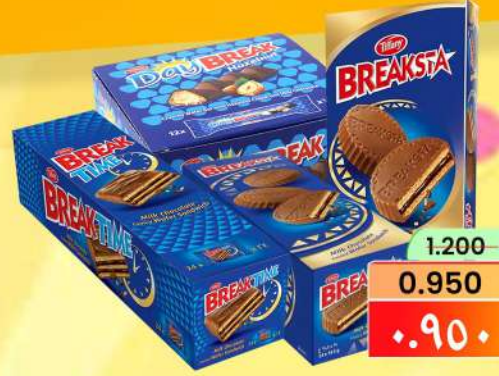
شوكولاتة بريك TIFFANY BREAK CHOCOLATE ASRTD/PKT