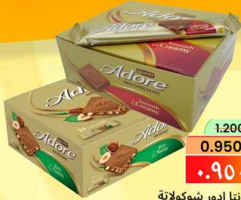
كوانتا ادور شوكولاتة ADORE CHOCOLATE ASRTD/PKT