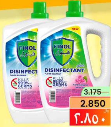
مطهر فينول FINOL DISINFECTANT 2X3LTR