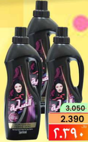
بحر عباية BAHAR ABAYA 3X1LTR