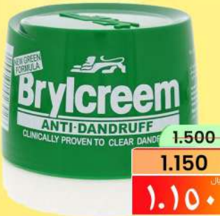
بريلكريم مضاد للقشرة BRYLCREEM ANTI DANDRUFF 210ML