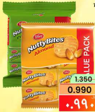
تيفاني نوتي بايتس TIFFANY NUTTY BITES ASRTD 8X82GM/PKT