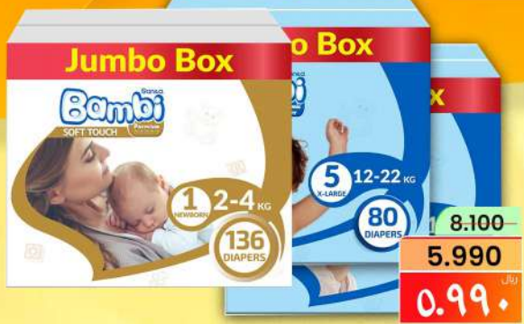
صندوق الحفاضات بامبي BAMBI JUMBO / BOX (NO 1/2/3/4/4+/5/6)

From 2025 January 21,22,23,24,25,26,27,28&29 ٢٠٢٥ يناير ٢١ إلى ٢٩ يناير ٢٠٢٥