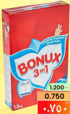
بونكس مسحوق تنظيف BONUX DITERGENT POWDER 1.5KG