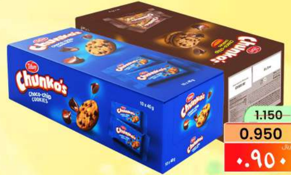
تيفاني تشونكوس TIFFANY CHUNKOS ASRTD 10X43GM/BOX