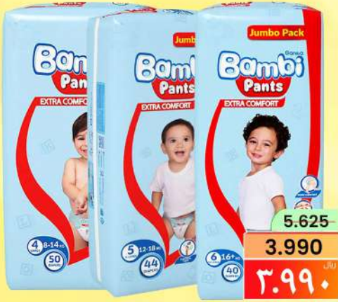
حفاضات بامبي بانت BAMBI PANT NO-4.-50/5-44/6-40