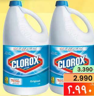
كلوركس مبيض جالون CLOROX BLEACH GALLON 2PCS