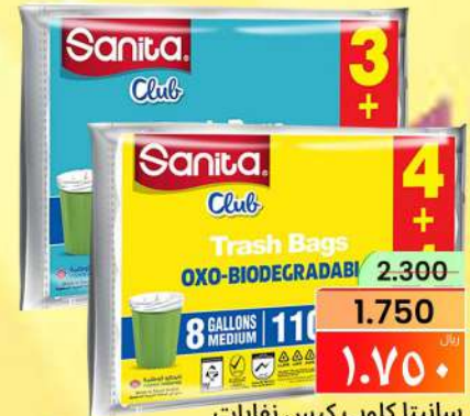
سانيتا كلوب كيس نفايات SANITA CLUB TRASH BAG /PKT