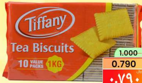
بسكويت الشاي تيفاني TIFFANY TEA BISCUIT 1KG