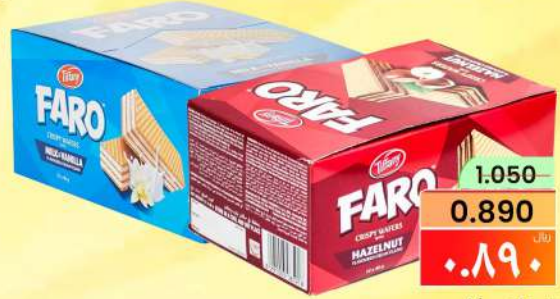
تيفاني فارو TIFFANY FARO ASRTD 12X45GM/BOX