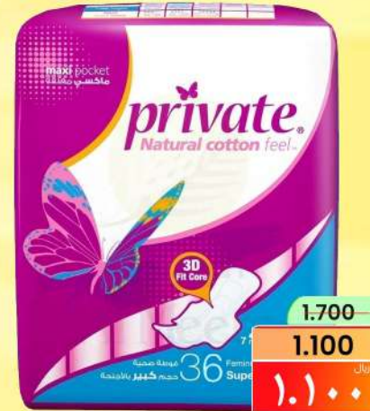
برايفت ماكسي سوپر PRIVATE MAXI SUPER 30+6S