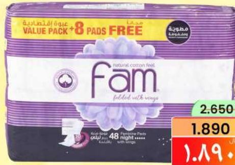
فام فوط نسائية ليلية FAM FEMININE PADS NIGHT 40+8S