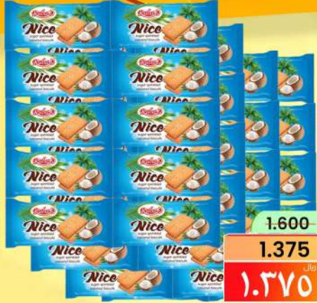
RUBA BISCUITS ASRTD 40X45GM بسكويت ربي

من ٢١ يناير إلى ٢٩ يناير ٢٠٢٥ 21,22,23,24,25,26,27,28&29