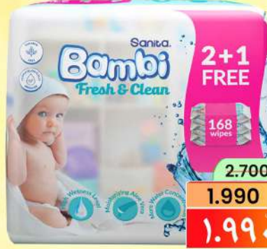
بامبي مناديل مبللة BAMBI WET WIPES TRI PACK