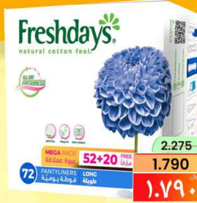
فراشدايز حزمة ضخمة طويلة FRESHDAYS LONG MEGA PACK 52+20