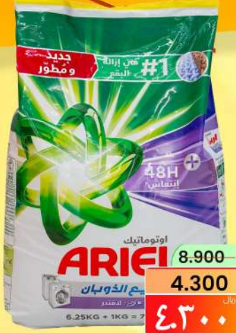
اريال تيك لافندر أخضر ARIEL TICK GREEN LAVENDER 4.5KG

From 2025 January 21,22,23,24,25,26,27,28&29 ٢٠٢٥ يناير ٢٩ إلى يناير ٢١