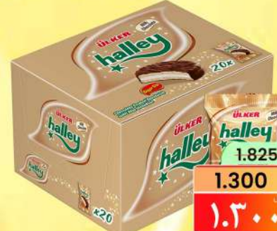
أولكر هالي شوكولاتة بالحليب ULKER HALLEY MILK CHOCO 20X26GM