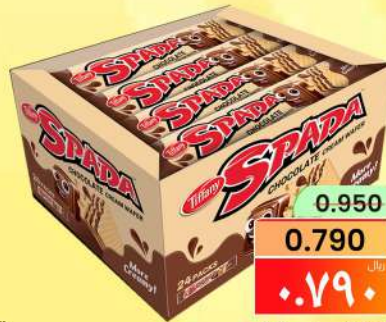
تيفاني سبادا TIFFANY SPADA 24X20GM