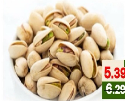
فستق تركي محمص ROASTED PISTA TURKEY