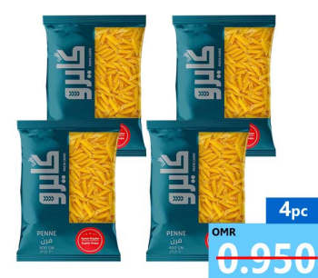
مكرونه كايرو Silo cairo macroni 4x400gm