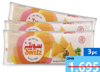
عجينة سمبوسة 3 حبه Switz sambosa leaves 3x500gm