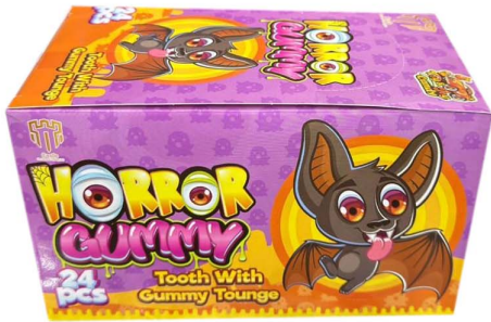
حلوى جيلي Horror gummy 24pc