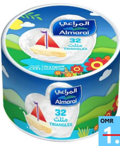
جبين مثلثات المراعي Almarai 8prt 4x120gm