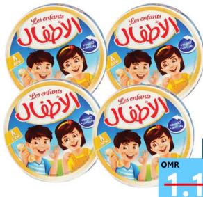
جبين اطفال L/E chesse 4x8prt