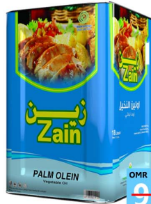
زيت نخيل زين Zain oil 17ltr