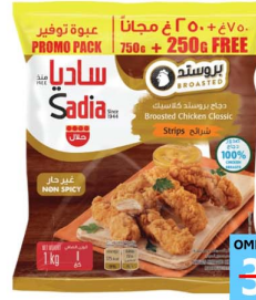
شرائح دجاج ساديا Sadia chkn strips 750+250gm