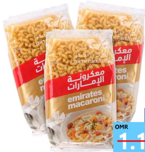
مكرونه الامارات 3 حبه Emirates corni 3x400gm