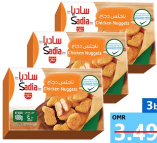
ناجتس دجاج ساديا 3 حبه Sadia chkn nuggets 3x400gm