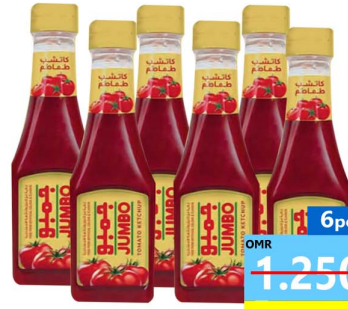
كاتشب جمبو 6 حبه Jumbo tmt ketchup 6x325gm