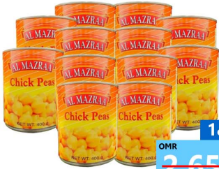
حمص المزرعة 12 حبه Al mazraa chick peas 12x400gm