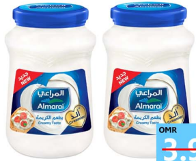
جبين المراعي 900x2 Almarai cheese 2x900gm