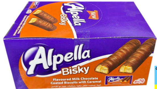
شيكلاتة ألبيللا Alpella bisky bar 24pc