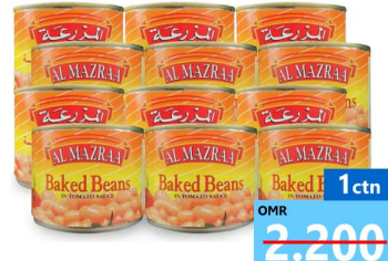
فاصوليا المزرعة 12 حبه Al mazraa baked beans 12x220gm