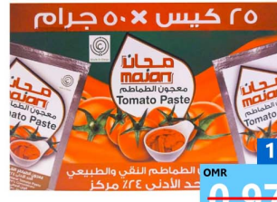
صلصل مجان 50x25 جرام Majan tmt paste 25x50gm