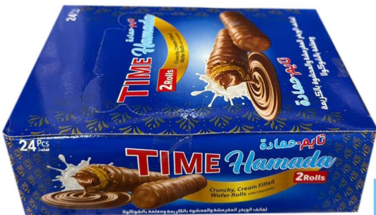
شيكلاتة تايم حمادة Time hamada wfer roll 24pc