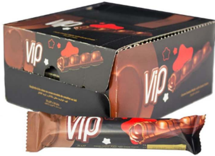
ويفر بالشيكلاته Solen vip wafer 24x25gm