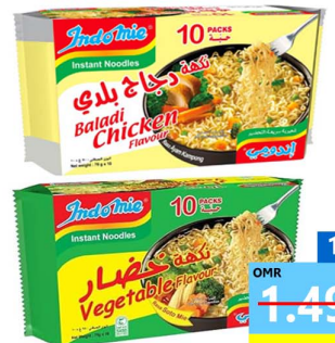
اندومي Indomie noodles 10x70gm