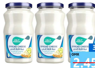
جبين مزون Mazoon cheese 3x240gm