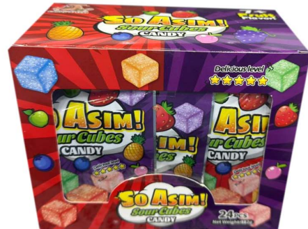
حلوى طرية So asim sour candy 24pc