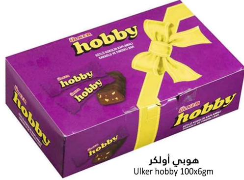
هوبي اولكر Ulker hobby 100x6gm