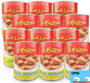
فول المزرعة 12 حبه Al mazraa fowl 12x400gm