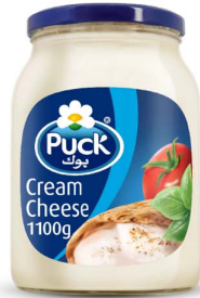
جبين بوك 1100 جرام Puck cheese 1100gm