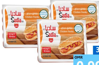
نقانق دجاج ساديا Sadia chkn franks 3x340gm