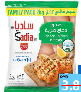
صدر دجاج طرية ساديا Sadia chkn tender breast 2kg