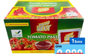
صندوق صلصل سرور Suroor tmt paste 25x50gm