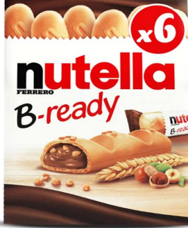
باسكوت نوتيللا Nutella B-Ready 132gm