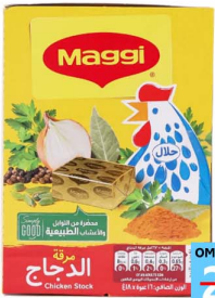
مكعبات ماجي Maggi chkn stock 24x18gm