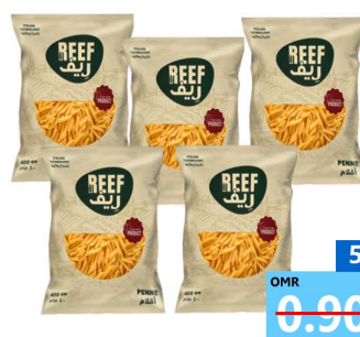
مكرونه ريف Reef macaroni 5x400gm