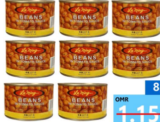
فاصوليا 8 حبه Laming baked beans 8x227gm