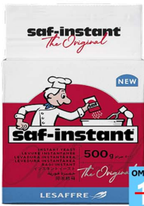
خميرة فورية 500 جرام Saf yeast 500gm